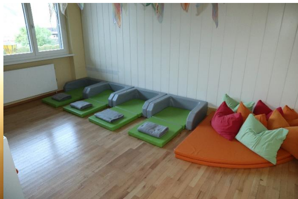
Ruhe- und Schlafrum